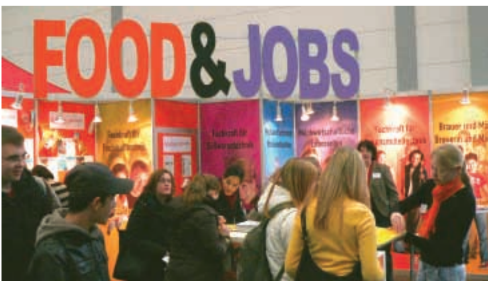
Messestand auf der »Berufe Live Rheinland« 2008.

Weitere NEW.S-Aktivitäten und die ausführlichen Informationen zu den Aus- und Weiterbildungsthemen finden Sie auf den NEW.S Internetseiten – oder rufen Sie uns einfach an!