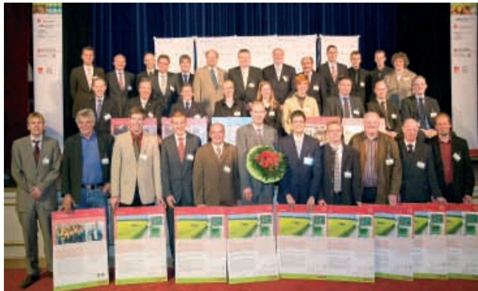
Die Preisträger der Kooperationspreise der Agrar- und Ernährungswirtschaft 2009 im GOP Bad Oeynhausen.

Gleichzeitig haben die Gäste auch sinnlich erfahren, wie Zusammenarbeit schmeckt: Teilnehmende Unternehmen hatten Spezialitäten aus ihrem Angebot gesponsert, die von den Köchen des GOP zu einem leckeren »Buffet der Kooperationen« arrangiert wurden. Der Abend klang bei anregenden Gesprächen im